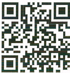
QR code ลงข้อมูล Google form

๑๐. ให้สำนักงานปศุสัตว์อำเภอรวบรวมเอกสารสำหรับเบิกเงินของ Mr. & Miss. หวัดนก ประจำหมู่บ้าน ภายในวันที่ ๒๕ ของทุกเดือน พร้อมกรอกข้อมูลในแบบฟอร์ม Google form