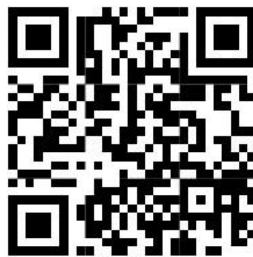
QR code ลงข้อมูล Google form

๑๔. ให้สำนักงานปศุสัตว์อำเภอรวบรวมเอกสารสำหรับเบิกเงินของ Mr. & Miss. หักเงิน ประจำหมู่บ้าน ภายในวันที่ ๒๕ ของทุกเดือน พร้อมกรอกข้อมูลในแบบฟอร์ม Google form